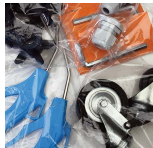
FERRAMENTA / POLIETILENE HARDWARE / POLYETHYLENE