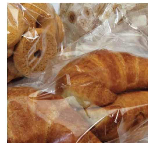
DOLCI DA FORNO / CAST CONFECTIONERY / CAST