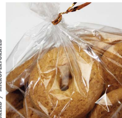
BISCOTTI / CAST BISCUITS / CAST