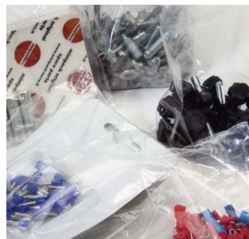
MINUTERIA / POLIETILENE MINUTIA / POLYETHYLENE