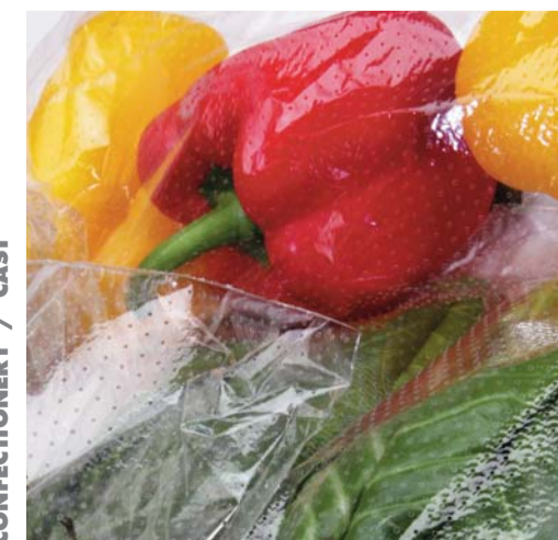
ORTAGGI / MACROFORATO VEGETABLES / MACROPERFORATED