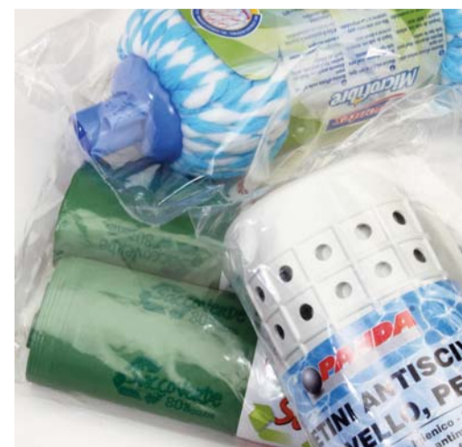
CASALINGHI / POLIETILENE HOUSEWARE / POLYETHYLENE