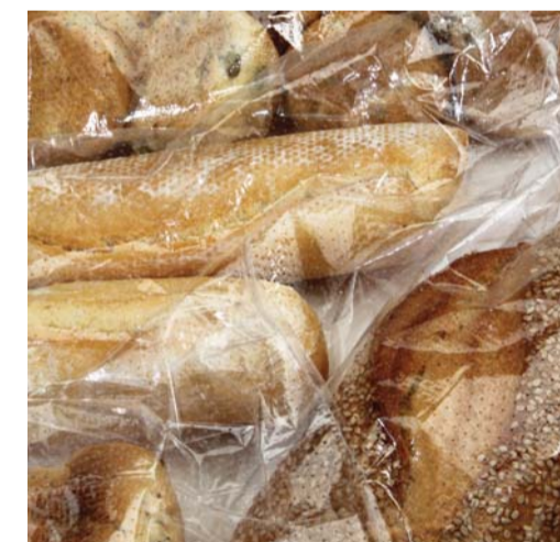
PANE / MICROFORATO BREAD / MICROPERFORATED