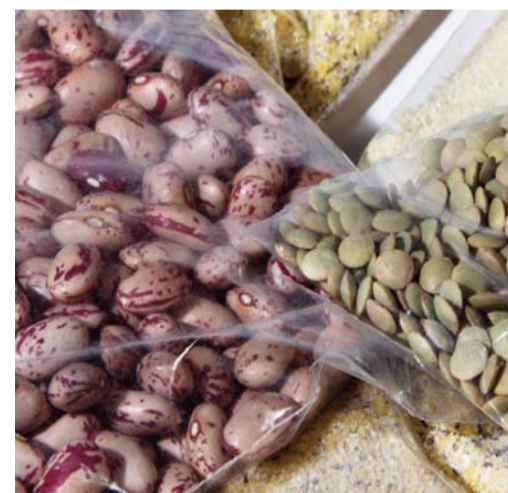
FARINE E GRANULARI / POLIETILENE FLOURS & GRANULAR PRODUCTS / POLYETHYLENE