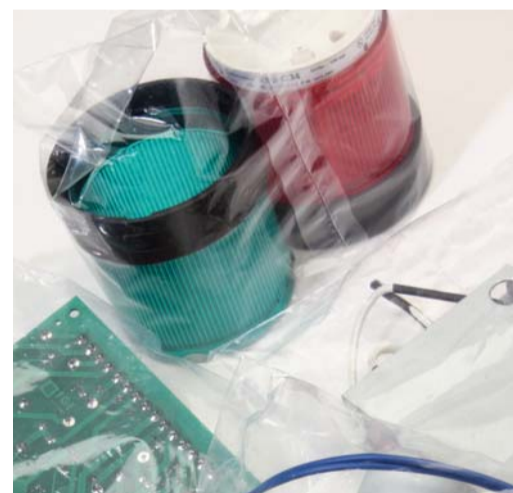
RICAMBI / POLIETILENE SPARE PARTS / POLYETHYLENE