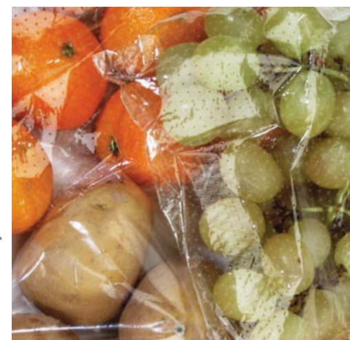
FRUTTA / MACROFORATO FRUITS / MACROPERFORATED