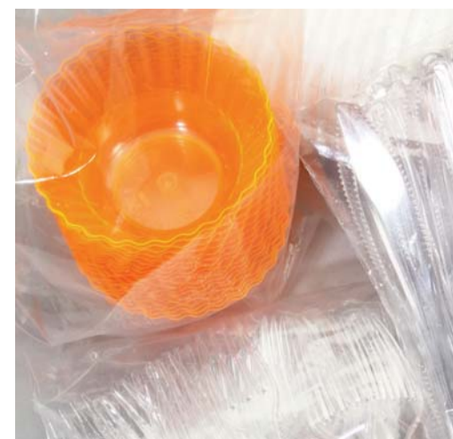
MONOUSO / POLIETILENE DISPOSABLE / POLYETHYLENE