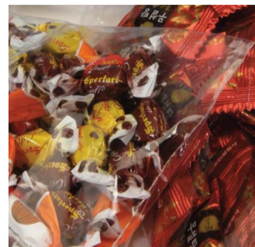
DOLCIUMI / POLIETILENE CANDIES & SWEETS / POLYETHYLENE