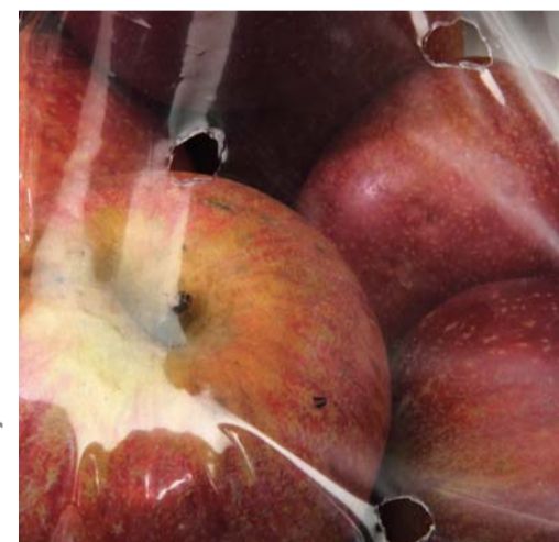
FRUTTA / POLIETILENE FORATO FRUITS / PERFORATED POLYETHYLENE