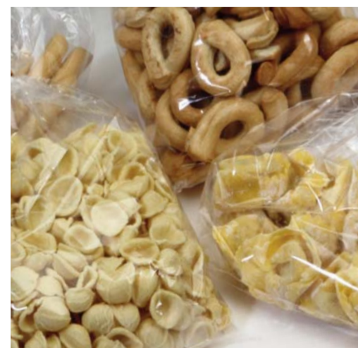
PRODOTTI TIPICI / CAST REGIONAL PRODUCTS / CAST