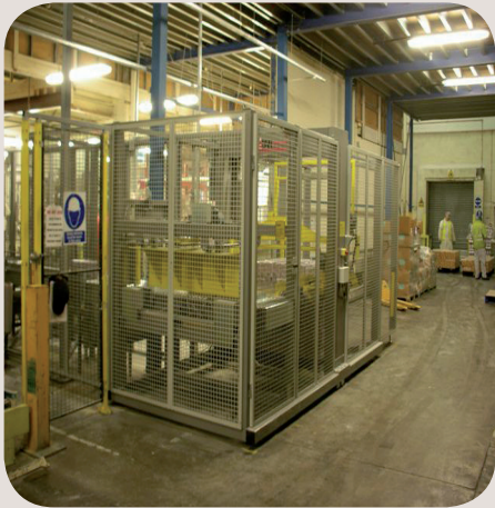
Allinson Flour produceert 3 verschillende zakken – 0,5 kg, 1 kg en 3 kg. Deze worden per 8 gebundeld in een krimpverpakking. De MK1 machine palletiseert 10 pakketten (80 zakken) per minuut.

Allinson Flour produceert 3 verschillende zakken – 0,5 kg, 1 kg en 3 kg. Deze worden per 8 gebundeld in een krimpverpakking. De MK1 machine palletiseert 10 pakketten (80 zakken) per minuut. Dit is vergelijkbaar met 4,5 ton per uur (36 ton per shift).